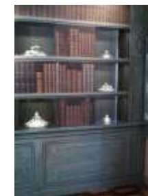
Trompe l'œil visible au château de Seneffe ;